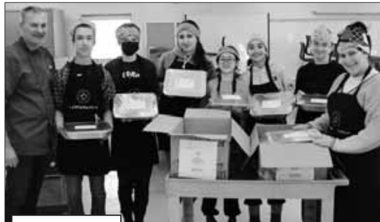
La Table des Chefs

Bon voyage et bon succès à la Brigade Culinaire de l'ÉSA!